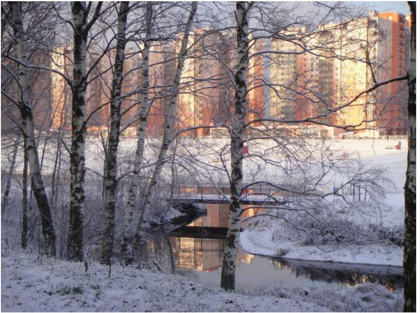
Во дворе - действующий детский сад с начальной школой