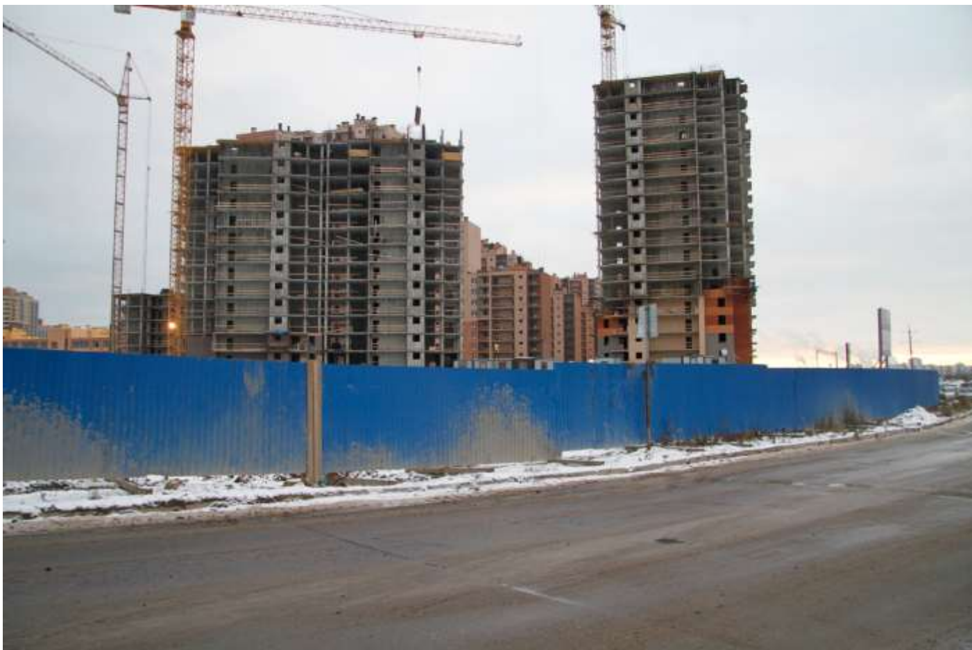
Вид с Областной ул. на секции 25-22, 18-19