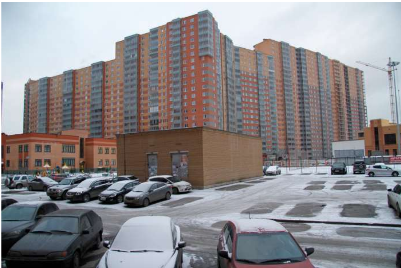
Вид со стороны детского сада на секции 12-4, 35-29