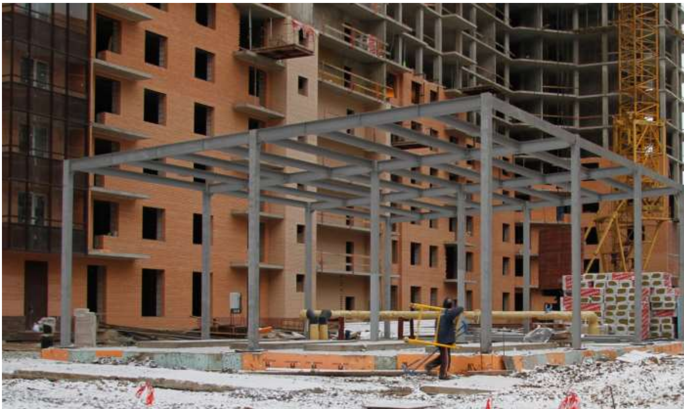
Вид со двора на строящуюся котельную и секции 17-19