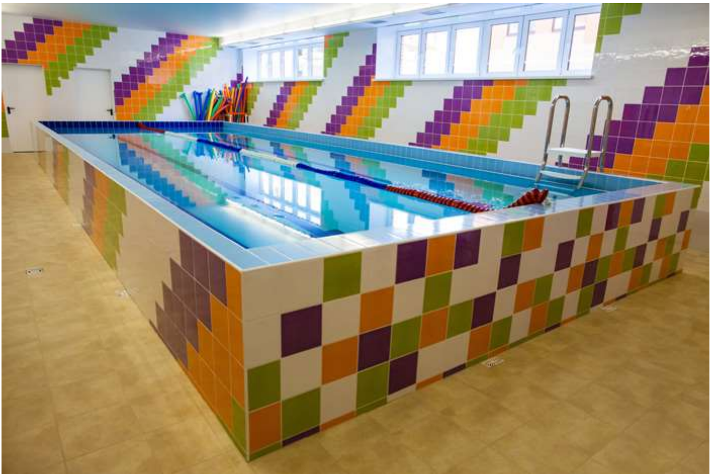
Под окнами - действующий спортивный комплекс с бассейном и ледовой ареной