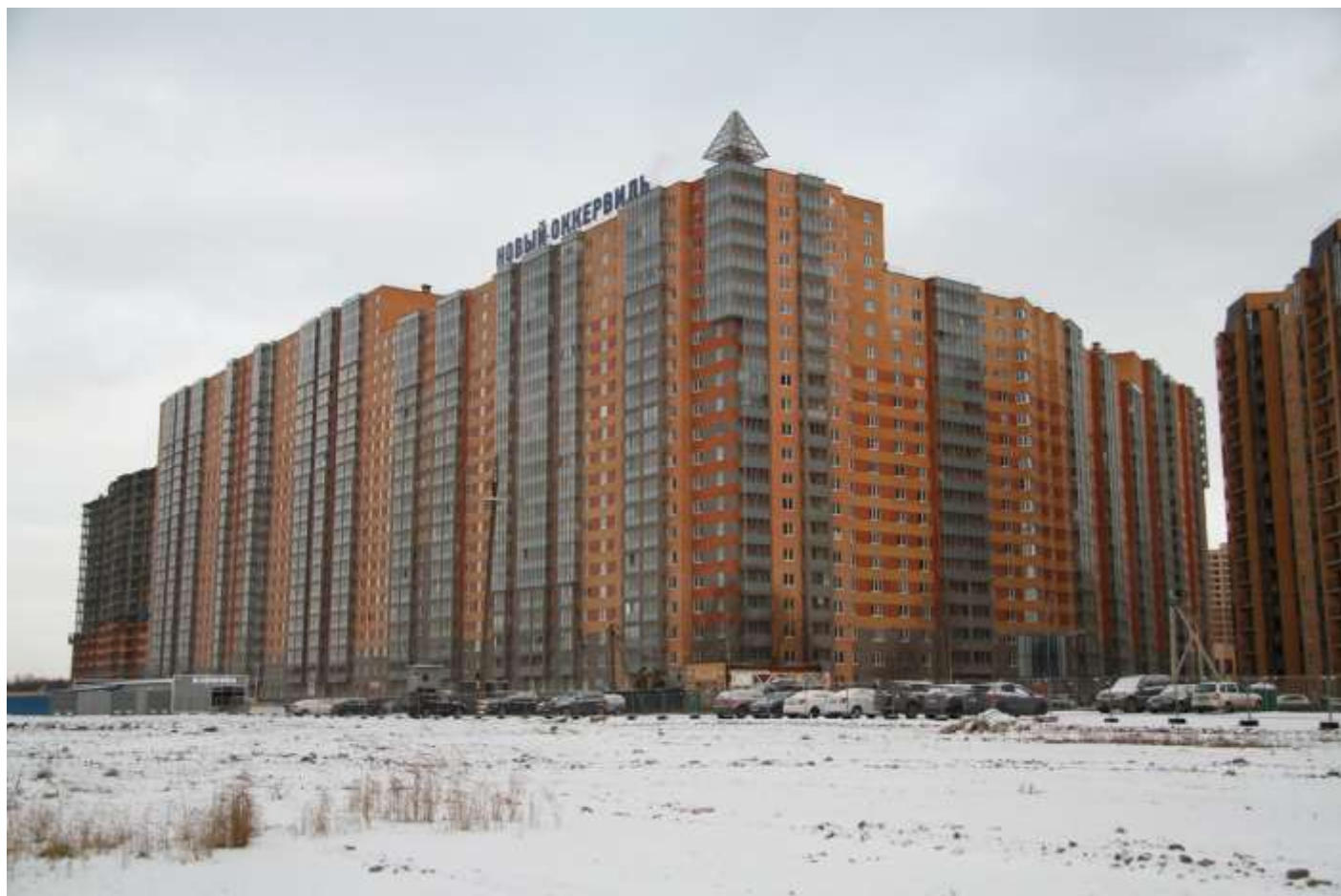
Вид с Областной улицы на секции (слева направо) 17-7